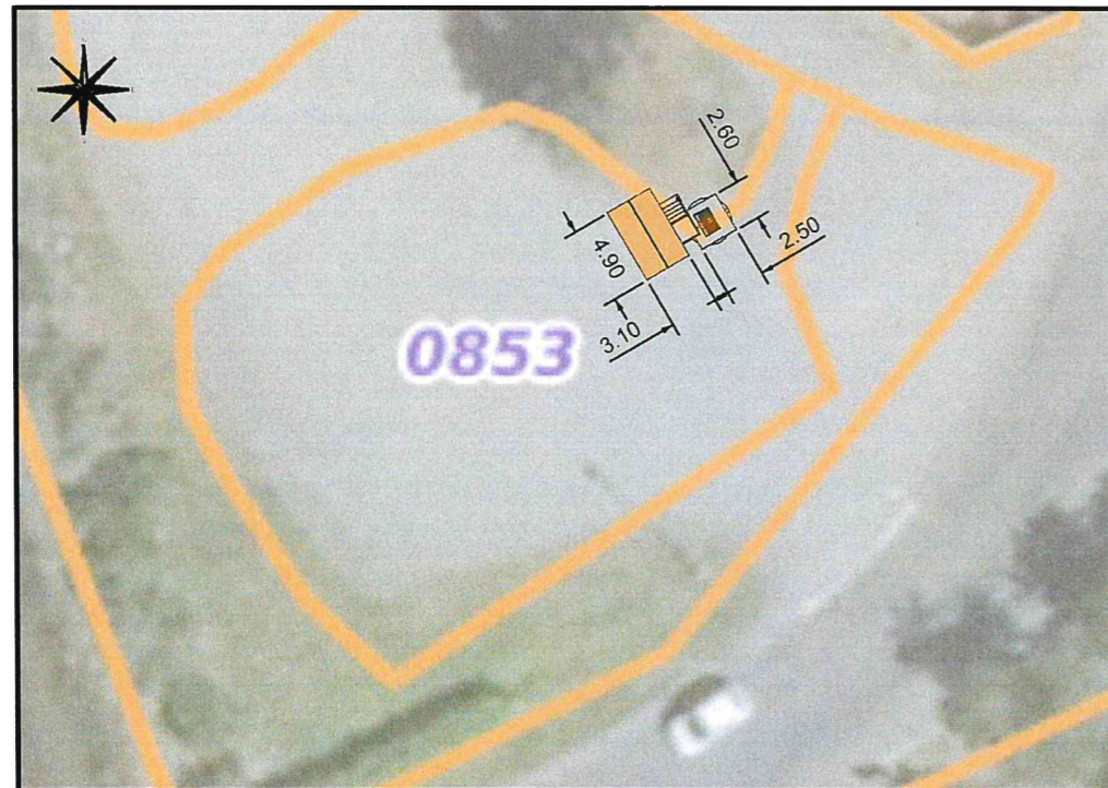
PLAN DE MASSE Ech 1/500 ème